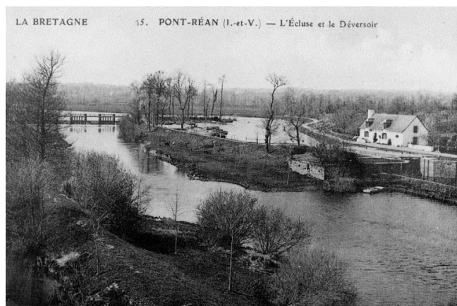
Jacques Martin (reproduction) J. Sorel Edit. Rennes © Mairie de Bruz